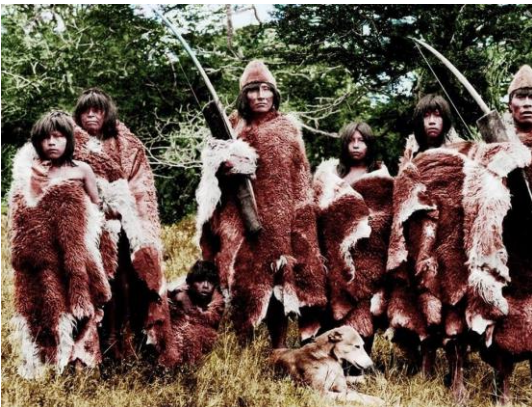
Pueblo Selk'nam en el pasado

Dato Curioso: El fuego era muy importante, realizaban muchas fogatas por eso el nombre de Tierra del Fuego.