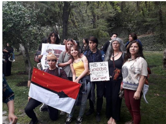
Pueblo Selk'nam en el presente